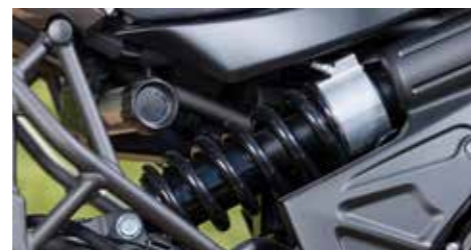
Met een draai aan de knop is de schokdemper aan de achterzijde nu te verstellen