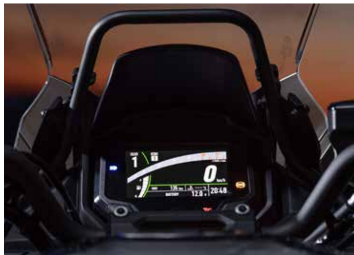
Compleet nieuw TFT-display