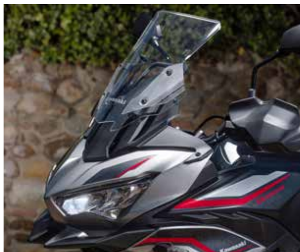
De ruit is nu zonder gereedschap te verstellen

in dit geval niets op tegen hebben. Het prijskaartje swingt niet de pan uit (integendeel) en verder hoeft die tractiecontrole je slechts één keertje te behoeden van een val-