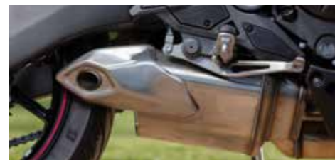
De laaggeplaatste demper heeft mede als voordeel dat je hem wat makkelijk een tuin indraait