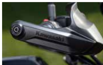
Niet standaard wel een aanrader: de originele handkappen