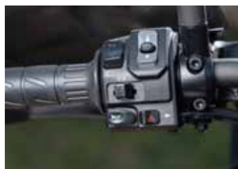
Het dashboard bedienen je voortaan via het stuur