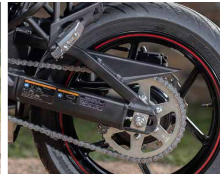
Het vermogen wat via de ketting op het achterwiel wordt overgebracht is meer dan voldoende

dien vinden we er voortaan ook een verstelbare KTRC-tractiecontrole in terug met 3 modi: 1, 2 en OFF. Nu kan je jezelf afvragen welk nut zo'n rijhulpje heeft op een tweecilinder