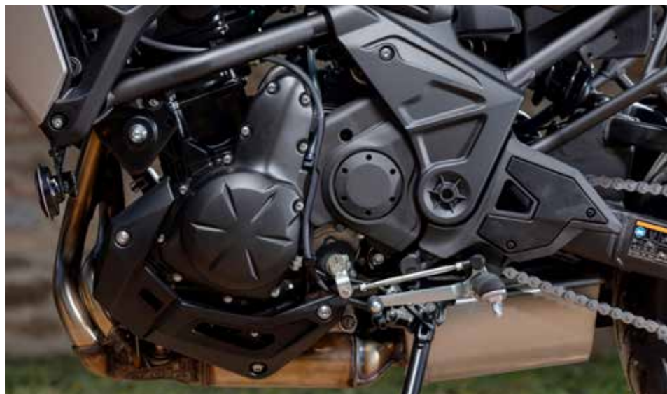
De parallel-tweecilinder hangt heerlijk soepel aan het gas

daard USB-aansluiting - die er stuk voor stuk voor zorgen dat deze Versys zich qua inzetbaarheid gerust kan meten met motoren van een paar prijscategorieën hoger.